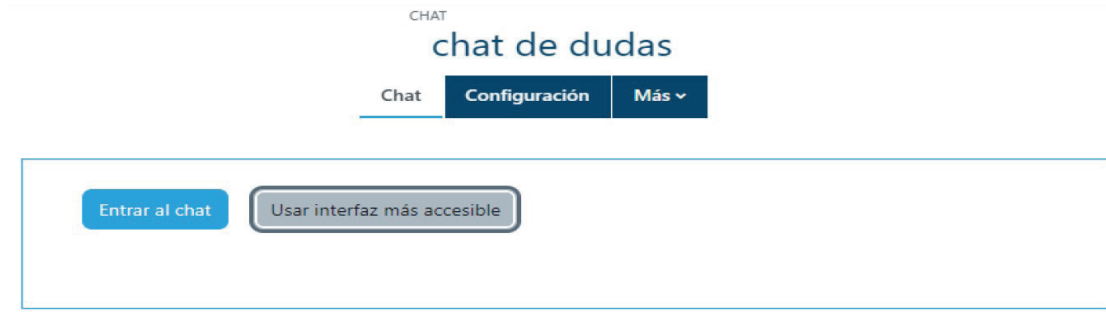
Figura 2. Pantalla principal de un chat

Una vez que ingrese usted verá la pantalla que se muestra en la Figura 2. Aquí aparecerán las instrucciones para participar en el chat, además de los enlaces para entrar propiamente a la sala de chat.