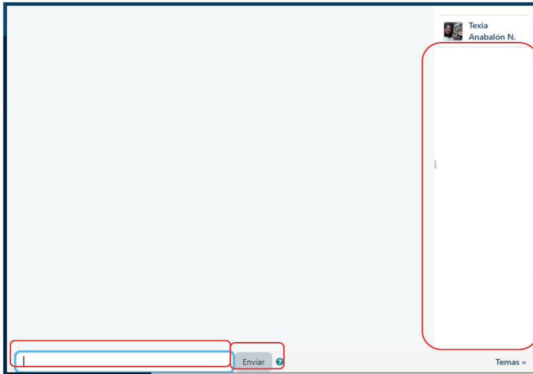
Figura 3. Sala del chat en su versión regular

tiempo real con los mensajes de todas las personas que participan en la conversación. En la ventana regular del chat aparece, en el panel a la izquierda, el espacio en el que se irán agregando los mensajes conforme van ingresando (ver Figura 3). En el encabezado de cada mensaje aparece el nombre de la persona que lo envía y la hora exacta a la que lo hizo. Por su parte, a la derecha podrá ver su nombre y fotografía.