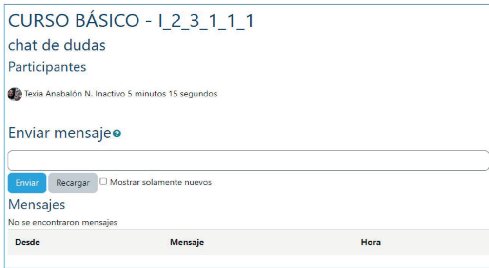
Figura 4. Sala del chat en su versión más accesible