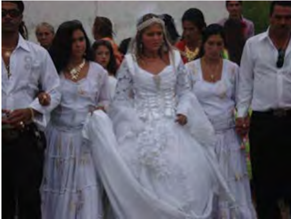
Figura 2 - Simbolismo da cor em um matrimônio calon