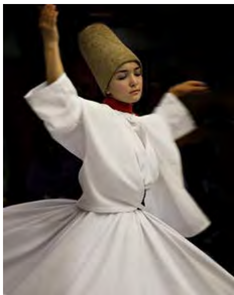
Figura 2 - Muçulmana Sufi Dervixe