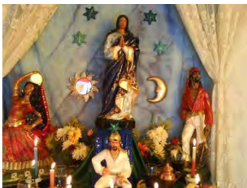
Figura 3 - Altar dedicado à Santa Sara Kali e aos espíritos ciganos