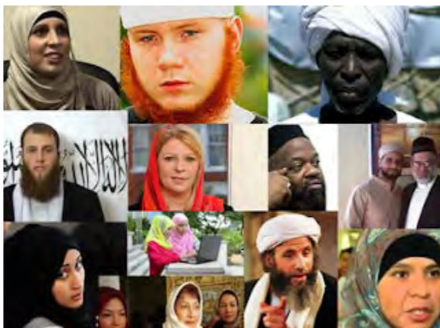
Figura 1 - Diversidade étnico-cultural no Islã