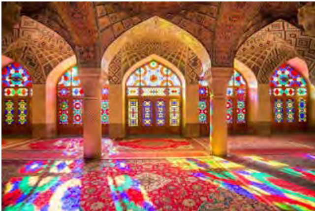
Figura 1 - Mesquita Nasir Al-Mulk no Irão